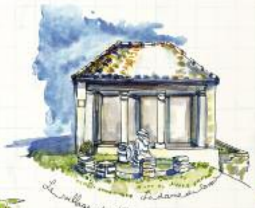
Le Village de Bouillonn