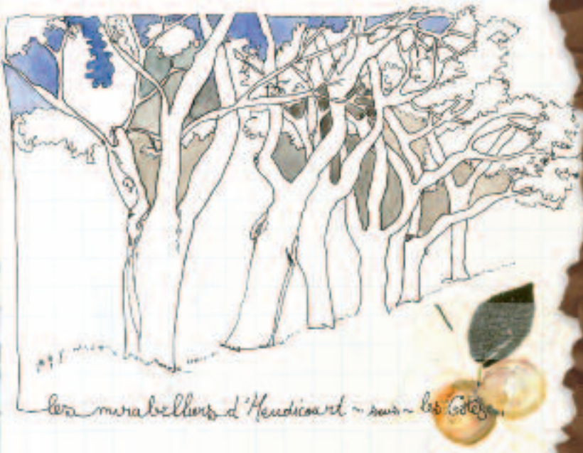
Les merveilleux d'Heudicourt - sur - les Côtes

À votre arrivée au lac de Madine, il vous est possible de rester quelques jours et de profiter de ce moment pour faire le Tour du lac à vélo. Cette petite piste qui fait l'objet d'un balisage spécifique, permet d'accéder facilement aux berges basses jusqu'à la pointe de la cornée du lac, secteur le plus intéressant à la belle saison pour l'observation des oiseaux.