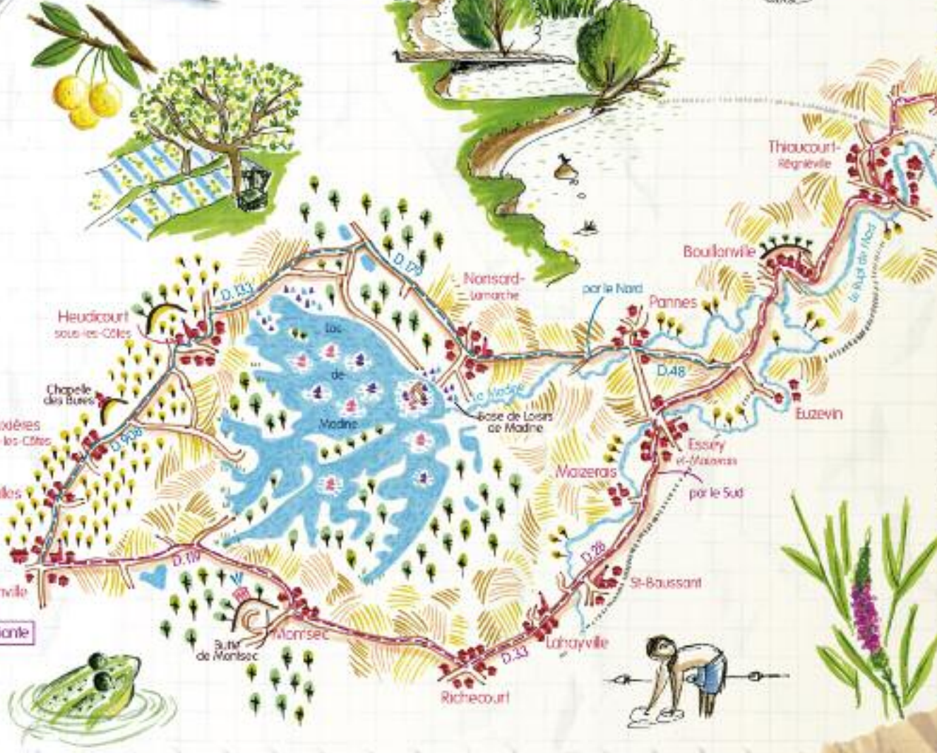
Arnville [ Tour du Parc à vélo, variante ]